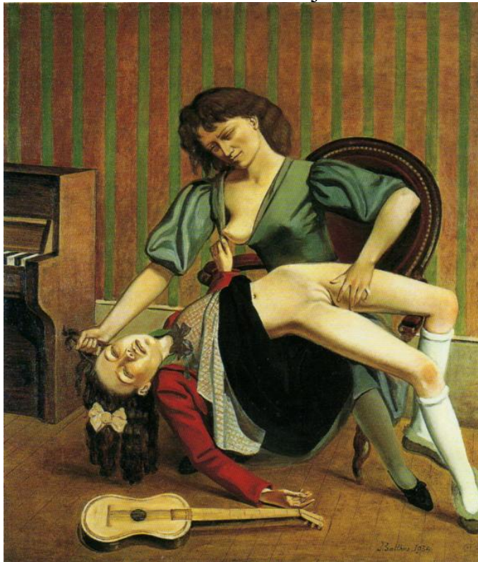
Balthus, De gitaarles , 1934.

beeldhouwwerk een leeg gekapte put. Soms werd er bij deze vernieling één beeld vergeten: dan kunnen we zien dat hun lid in een prachtige erectie staat. Blijkbaar was dat een goddelijk goed tweeduizend jaar voor onze tijdrekening; maar nadien (de christelijke tijd?) werd het een enorm taboe. “L’origine du monde”, het schilderij van Courbet (1819-1877) dat een close-up toont van het behaarde geslachtsorgaan van een volwassen vrouw, werd door de psychoanalist Joseph Lacan overdekt met een ander schilderijtje 5 . “De gitaarles” werd geweigerd door het Centre Pompidou in Parijs en het Museum of Modern Art in New York, op de grote retrospectieve van Balthus. Dat was in 1984. Het schilderij stelt een lesbische scene voor tussen