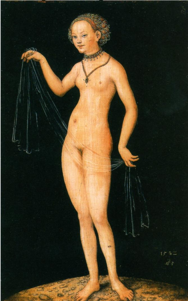
Lucas Cranach: Venus

Lucas Cranach (1472-1553) schildert vrouwe Justitia zoals vele anderen: met een weegschaal en een zwaard. Maar! in plaats van geblinddoekt kijkt de “Gerechtigheid” dromerig voor zich uit, zij is een prachtige, naakte, jonge vrouw, alleen gekleed met juwelen rond de hals en een medaillon tussen de borsten 143 . Ze verschilt nauwelijks van de andere naakte vrouwen die Cranach afbeeldde, zoals de liggende wulpse bron nymf, en Venus; alleen bij deze is de schaamspleet eventjes zichtbaar. Eén zijn vrouwen draagt alleen een grote hoed en halssnoer, ze kijkt mij recht in de