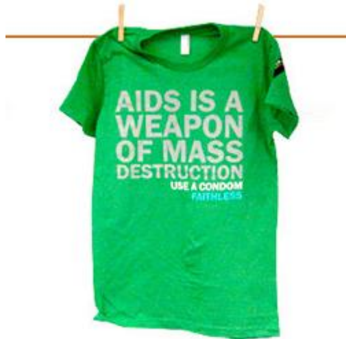
T-shirts uit de online condoshop van MJA-JOETZ

Maar seksuele praktijklessen, evengoed als lessen over haarkappen, koken (op TV en op de boekenbeurs komen ze ons de keel uit), computers, wedstrijdzwemmen, treinbestuurder... – wie durft bij ons praktijklessen seks voorstellen? 148 . In het post-Dutroux klimaat, en door het wijdverspreid kinder-, beter: machts misbruik door celibaten, is seksuele praktijkervaring opnieuw meer taboe geworden. Opvoeding tot harmonische seksualiteit is noodzaak, maar vandaag onopgelost. Daarom moeten we, zoals 50 jaar geleden, blijven rekenen op mooi-geïllustreerde boeken met beschrijvingen over seksuele stimulatie en over genieten, over aandacht voor de partner. Veel speelfilms bevatten seksscènes, maar welk ideaalbeeld tonen ze? Ik