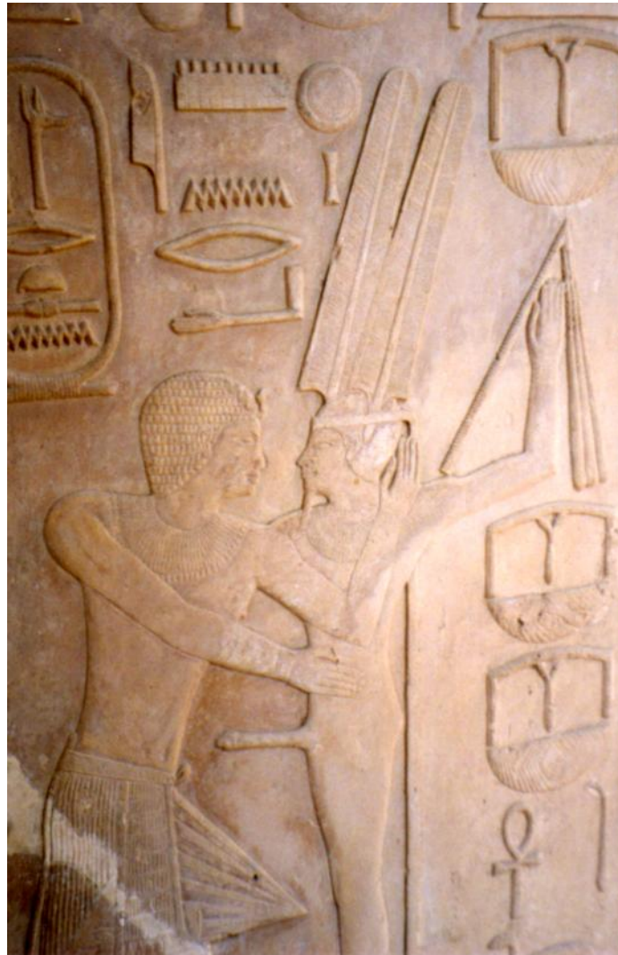
Eerder zeldzaam bewaard beeld van de erectie van Amon Ra, mogelijk met zijn vrouw Amunet. In de meeste reliëfs werd de penis later weggebeiteld. Luxor.

Veel mensen denken meteen aan seks wanneer het woord moraal valt. Weinig daden worden zo beladen met verbodsbepalingen als seks. Aartsbisschop Léonard's drie meest ophefmakende uitspraken gaan over seks 1 . Ter vergelijking: moraal wordt veel minder te pas gebracht wanneer we geld aan het verdienen zijn, of oorlog voeren; en dit zijn twee activiteiten die het mensdom voortdurend bezighouden doorheen de hele geschiedenis in bijna alle culturen. Eten en drinken, die evengoed biologische functies zijn als seks, worden familiaal en maatschappelijk georganiseerd. Honger en dorst beschouwen we meestal als verwerpelijk – of het moest zijn als middel om druk uit te oefenen op gevangenen, of op een belegerde stad van de vijand. Vasten speelt een rol in het christendom en de islam voor de zuivering van lichaam en geest – maar steeds is de maatregel in de tijd